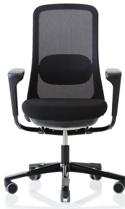
Design: Frost Produkt AS, Powerdesign AS och Flokk Design Team Patent- och design skyddad