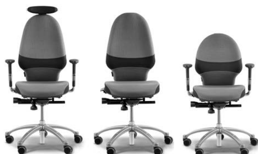
RH Extend 220 w/ neckrest and armrests